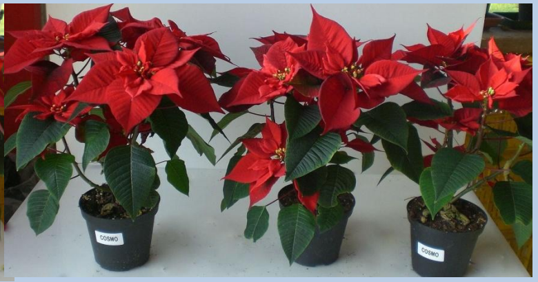
Da tunnel (a sx posizione più luminosa)