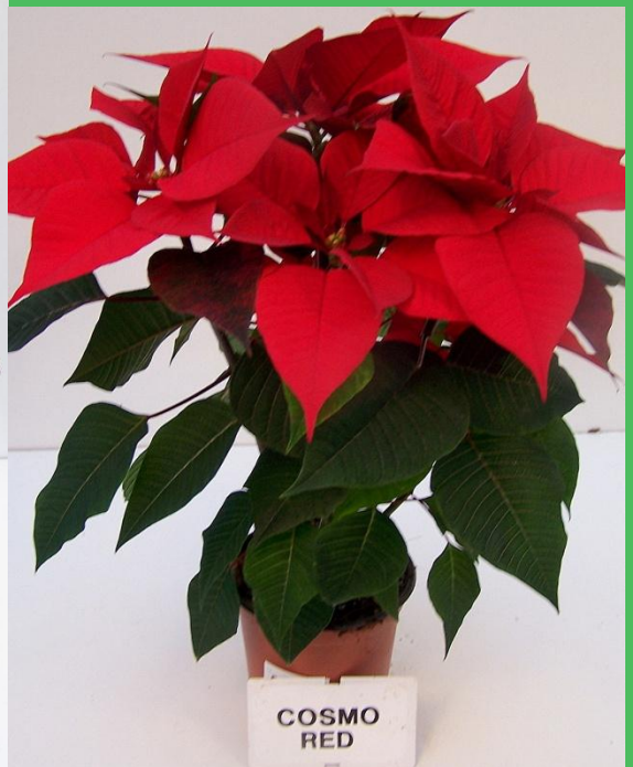
(T molto bassa)