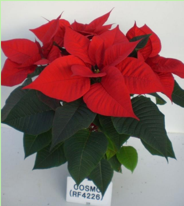
serra (T media)