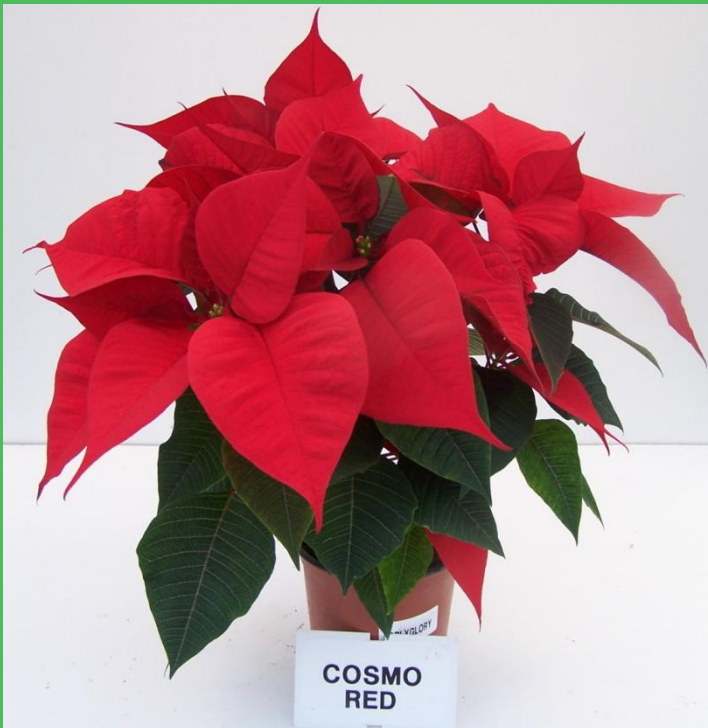
Tunnel (T media)