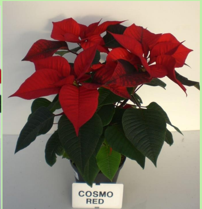
tunnel (T molto bassa)